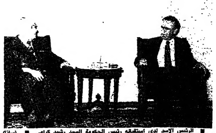
الرئيس الأسد لدى استقباله رئيس الحكومة السيد رشيد كرامي (سلف)

يعد قبل ظهر اليوم في العاصمة السورية اجتماع وزاري لبناني - سوري موسع يحضره الوزراء سليم الحص ونبية بري ووليد جنبلاط إضافة إلى الرئيس رشيد كرامي وذلك في مكتب نائب الرئيس السوري السيد عبد الحليم خدام. وكان السيد خدام اتصل مساء امس بالوزيرين السوريين وبعلمه لزيارة دمشق والمشاركة في مناقشة مجمل القضايا اللبنانية التي طرحها الرئيس رشيد كرامي خلال اجتماعه امس مع المسؤولين السوريين وانها ما يتناول اسباب عرقلة تنفيذ الخطة الأمنية السليمة والاقليم وبيروت والجبل والطرقات التي رافقت استقلاله وعودة الوزير الحص، أي الملف الأمني اللبناني برمته، والاسباب التي تعوق مسيرة الجيش اللبناني في الجنوب. في وجود رئيس الحكومة ونصف اعضاء الوزارة في دمشق لتجلى جلسة مجلس الوزراء اليوم في ظل الحص، وكان الرئيس حافظ الأسد استقبال رئيس الحكومة السيد رشيد كرامي بعد ظهر امس بحضور السيد عبد الحليم خدام نائب رئيس الجمهورية والدكتور